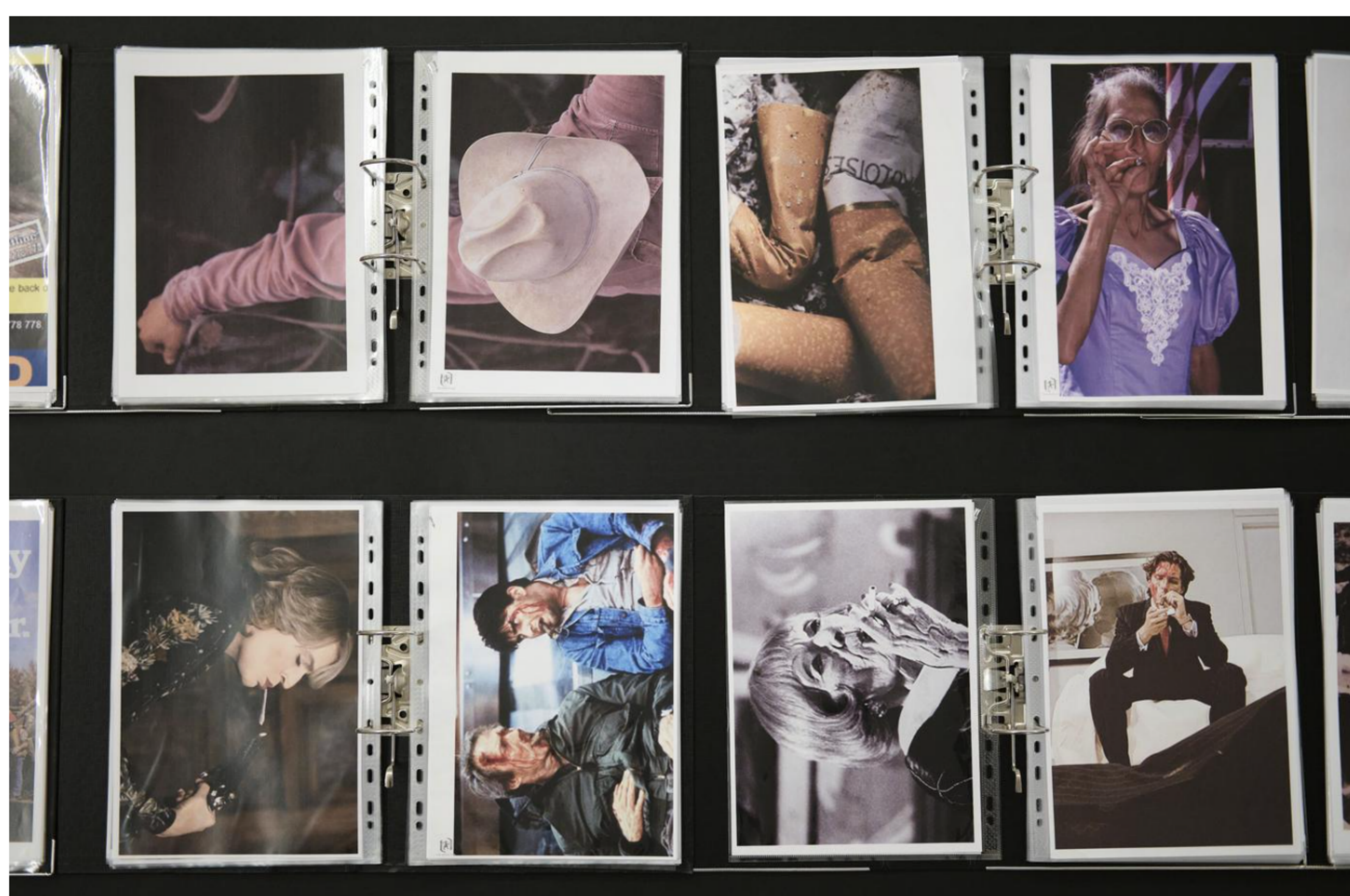
"The Tobacco Files, Laëtitia Badaut", Haussmann, Fonds de dotation Franklin Azzi.

« Tobacco Files » de Laëtitia Badaut Haussmann, jusqu'au 18 novembre, 13, rue d'Uzès, 75002 Paris.